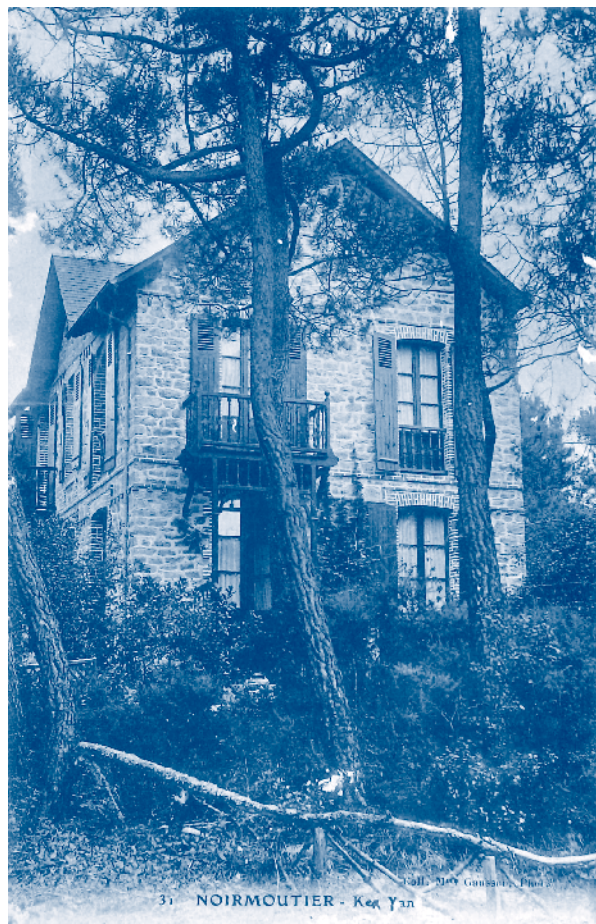
Une villa du Bois de la Chaise, début XXe siècle. Carte Postale.