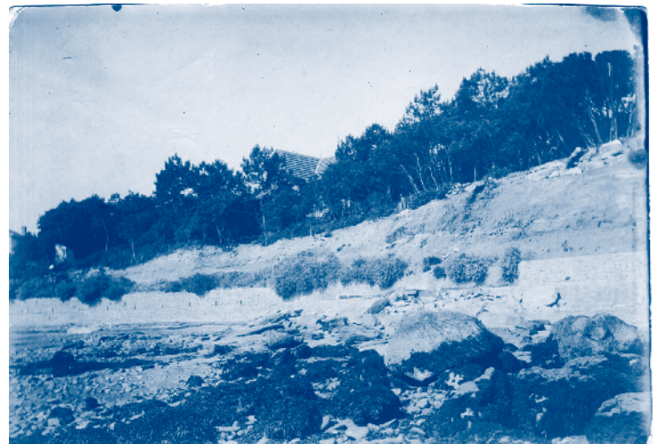
La Plage des Souzeaux et le Bois de la Chaize au début du XX e siècle

Extrait de « Écho de St Filibert de Noirmoutier », N° 96, décembre 1904. Archives Les Amis de l'Île de Noirmoutier